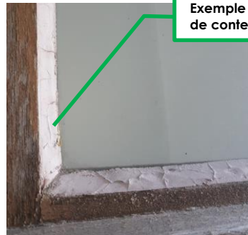
Exemple de mastic susceptible de contenir de l'amiante